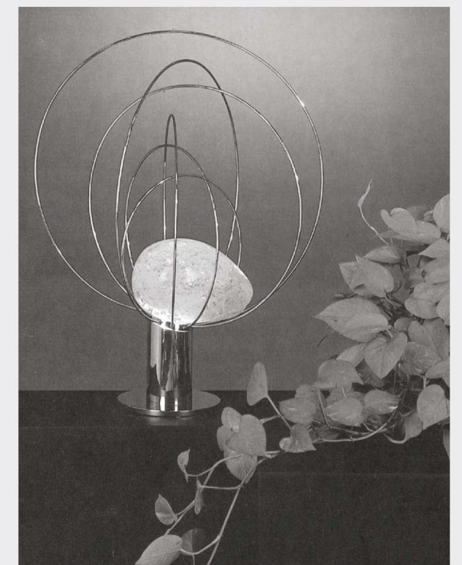
Image from the original catalog